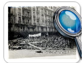
Баррикады в Алжире